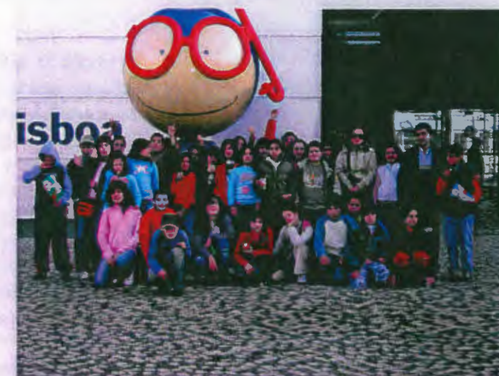
o olhar atento da guia, que pôs à prova os conhecimentos adquiridos no decurso da visita. Ficou provado que as meninas acompanharam a visita com mais atenção.

Depois do almoço, os alunos visitaram o Palácio Nacional de Mafra, onde puderam ver as “burras”, arcas que transportavam o ouro vindo do Brasil, além dos aposentos do rei e da rainha e as suas casas de banho, as salas do trono, de estar e de jantar, retratos e pinturas que representam a vida da corte e militar, a biblioteca e a igreja. Ouviram a guia falar da nossa história, principalmente, do reinado de D. João V, tendo no final realizado um jogo, sob